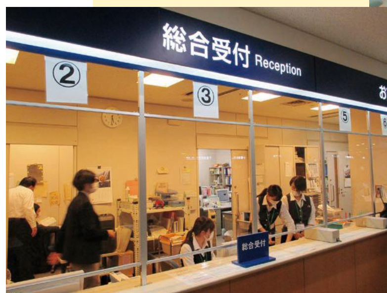
アクリル板を設置した受付窓口