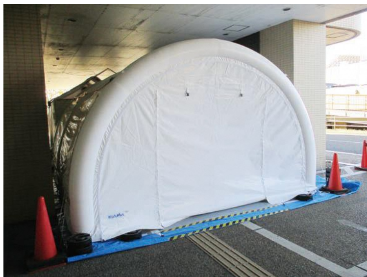
発熱外来用の患者待合用テント

診察の結果、やはり新型コロナ感染が疑われる場合にはPCR検査を行います。新型コロナ感染を疑わないと医師が判断すれば、院内への立入りを許可、一般外来へご案内します。発熱外来を経由した分だけ