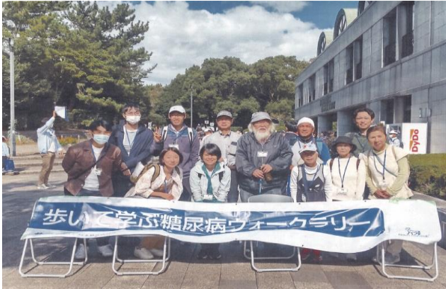
〈 ウォークラリー 〉