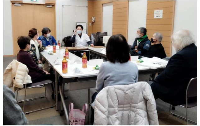
〈 患者おしゃべり会 〉

「青葉友の会」は、千葉市立青葉病院における糖尿病患者会です。患者さん同士や医療スタッフとの交流を通じて、糖尿病のことを正しく知り、知識を深める場を設けさせていただいています。