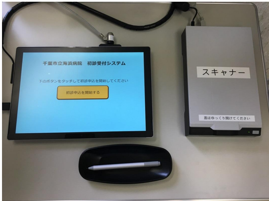
入力用タブレット端末 (& 保険証読込用スキャナー)

◆ご来院の際にスタッフが案内いたしますので、保険証をご用意いただき「新患受付」へお越しください。