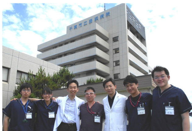
心臓血管外科チーム一同

私は2001年千葉大学を卒業後、東京女子医科大学心臓血管外科に入局。関連病院で研修した後、千葉県心臓血管外科専門医プログラムの1期生として千葉県循環器病センター、千葉県こども病院、船橋市立医療センターで研修を受けました。その後オーストラリア、カナダで計6年間、心臓外科の臨床に従事しました。海浜病院は、産科、NICU、小児科、循環器内科、また成人先天性心疾患治療が充実しているという特徴があります。そのような海浜病院の特徴を生かし、心臓血管外科では新生児から乳幼児、15歳以上の先天性心疾患の患者さん、また成人の心臓病の患者さんを対象に心臓外科手術を担当します。海外での臨床経験をもとに、世界標準の医療を提供したいと思います。