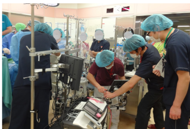
心臓血管外科手術再開のため、シミュレーションを重ねました。