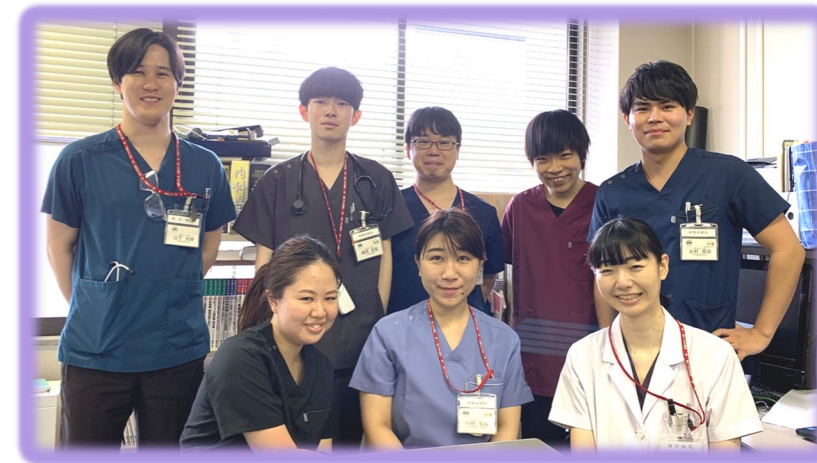
令和3年度 初期研修医一同

令和3年度の新たな研修医は基幹型4名と千葉大学の協力型2名のほか、短期研修は18名となります。1年次に研修医は内科、外科、小児科、産婦人科、救急科、麻酔科を研修します。短期研修は小児科、救急科、産婦人科、耳鼻咽喉科、形成外科、新生児科が選択されています。基幹型の2年次の研修医は必修の地域医療と精神科以外は自由選択で、将来進む道に合わせて個性ある研修を計画します。