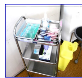
ワクチン接種が安全にできるよう しっかり準備