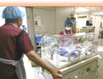
元気な赤ちゃんが生まれました