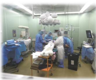
陽性妊婦さんが無事にお産できますように