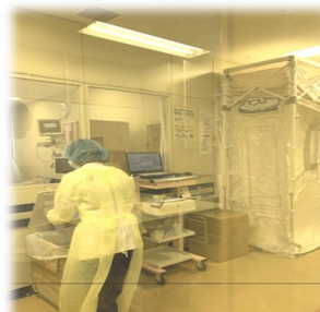
重症患者さんの回復を願って