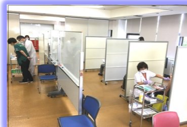
ワクチン接種の様子