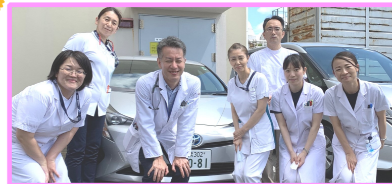
在宅診療支援チーム