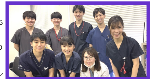
令和4年度 初期研修医

内科の専門研修も基幹病院となり、救急科と外科も専門研修プログラムを申請したところ。新病院に向けて、次世代を担う若い医師が力を発揮できるよう支援していきます。