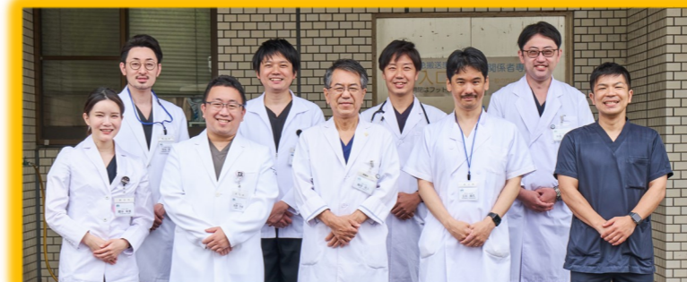
救急・集中治療部門